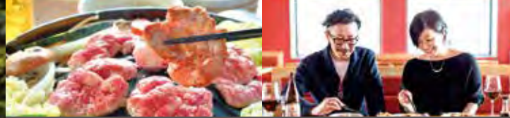
ショッピング&ダイニングエリア Shopping & Dining at The Village