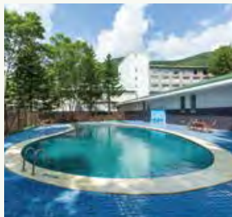
温泉プール Outdoor Thermal Pool

Located at the base of Mount Niseko Annupuri in Japan, The Green Leaf Niseko Village is an internationally acclaimed powder mecca and a summer destination for diverse outdoor pursuits. Orchestrated by award-winning New-York based firm Champalimaud Design, The Green Leaf Niseko Village reflects everything an all-season break should stand for.