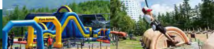
ニセコビレッジ自然体験グラウンド「ピュア」 Niseko Village Activities in Nature "Pure"