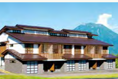
ザ・グリーンリーフ 温泉 The Green Leaf Onsen (Natural Hot Spring)