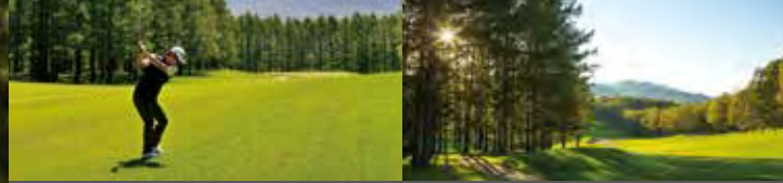
ニセコビレッジゴルフコース/ニセコゴルフコース Niseko Village Golf Course / Niseko Golf Course