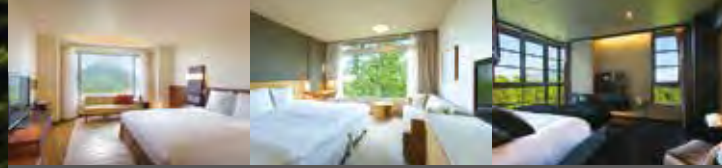
ヒルトンニセコビレッジ/ザ・グリーンリーフ・ニセコビレッジ カサラ・ニセコビレッジ・タウンハウス/ヒノデヒルズ Hilton Niseko Village / The Green Leaf Niseko Village KASARA Niseko Village Townhouse / HINODE HILLS Niseko Village