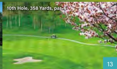
10th Hole, 358 Yards, par-4